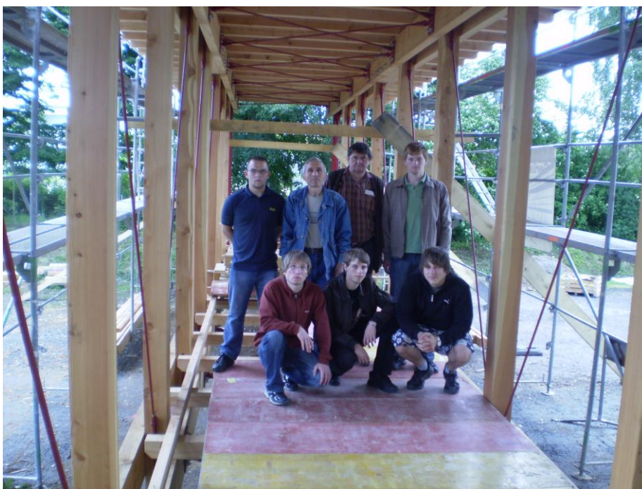
Dne 10.6.2011 – Slavnostní vyzvednutí jeřábem